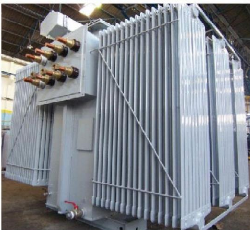
Loma Negra Argentina – Camargo Correa 2500 kVA 400 / 3.000 V